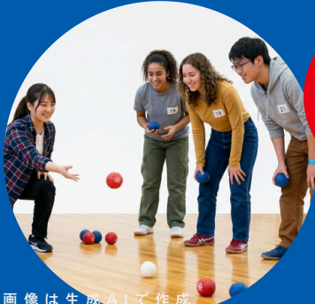
画像は生成AIで作成

対象：AYA世代でがんに影響を受けるすべての方（近い年齢の方も！） がんに体験した方、同世代で家族ががんに経験された方