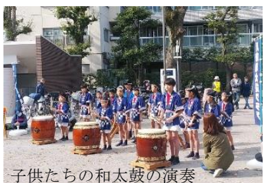
子供たちの和太鼓の演奏

11月17日（日）のグリーンフェスタは実行委員会形式での実施です。8時に東陽公園に集合して、テントや机・椅子を運び出し、設営を行いました。参加は8団体で、木工教室、巣箱づくり、ハーブ匂袋づくり、手作り品の販売、花壇植え替え教室などがありました。お宝倶楽部は、生ごみ4方式を紹介する展示だけだったので訪れる人は少なく、今後は子供たちにも興味を持ってもらえるような展示や、気軽に楽しめるようなクイズなどを通して生ごみ堆肥づくりを知ってもらうような工夫が必要だと感じました。